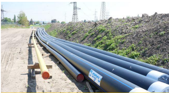
Los tubos AGRULINE de PE 100-RC garantizan el suministro de agua potable en las orillas del Danubio.

La alcantarilla del Danubio de 460m de longitud, se perforó mediante el método de elevación de tuberías con un cabezal perforador de 40 toneladas y se recubrió con tubos de hormigón. El trazado del túnel discurre en un radio de 1.600 metros. Las tuberías de agua potable, calefacción natural e Internet se soldaron, se colocaron sobre una estructura de vagón y se introdujeron en el tubo del túnel mediante un sistema de rieles.