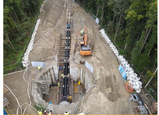
Los tubos pre soldados se introdujeron en la alcantarilla mediante un sistema de rieles.

AGRU, suministró en total más de 1.000 m de tuberías de PE 100-RC, incluidos los accesorios. Por motivos de precaución, en la alcantarilla del Danubio se instalaron dos tubos de calefacción urbana y un tubo de reserva de gas de alta presión de acero, así como 16 tubos de protección de cables de plástico para electricidad y fibra óptica.